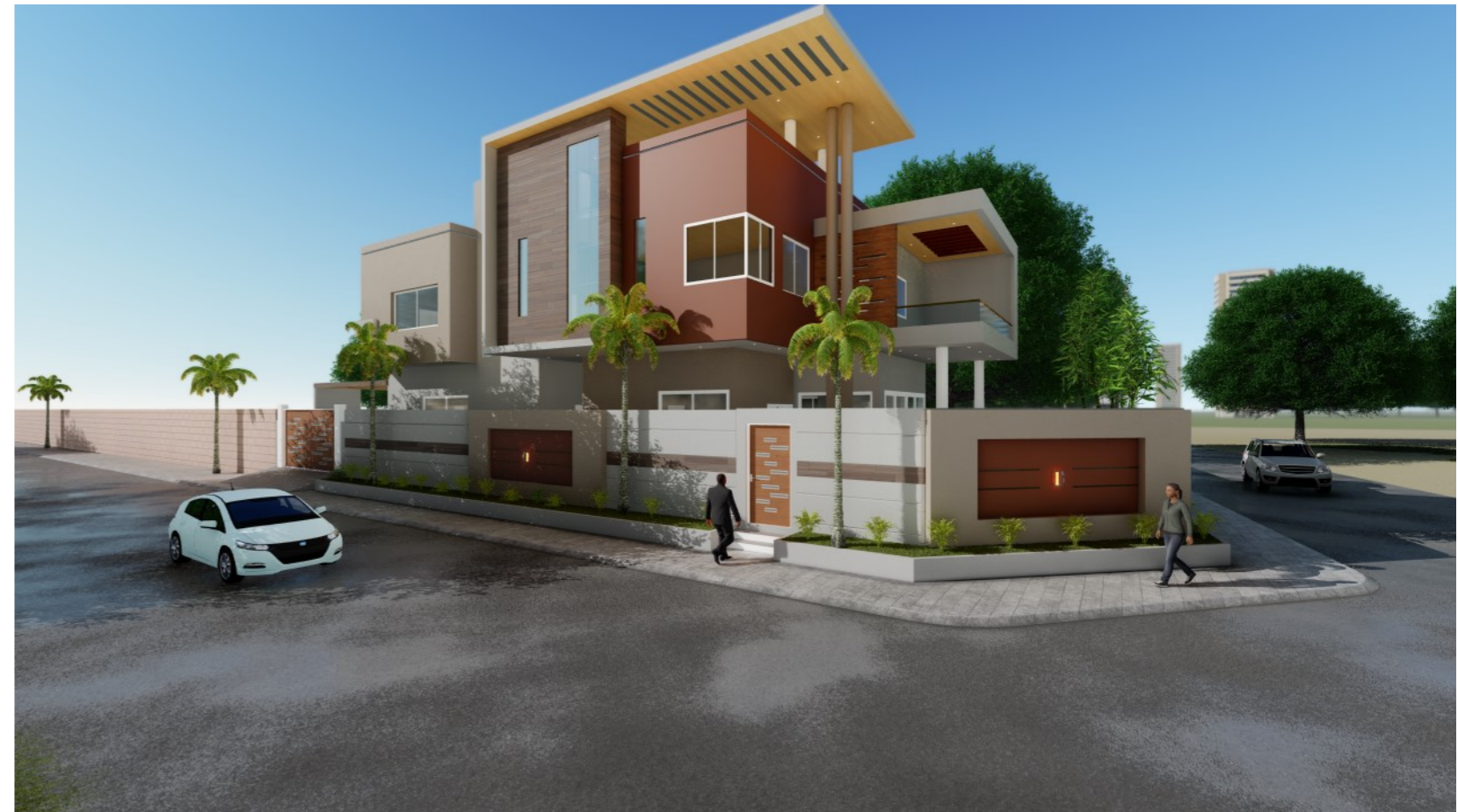
VUE DE PROFIL DROITE