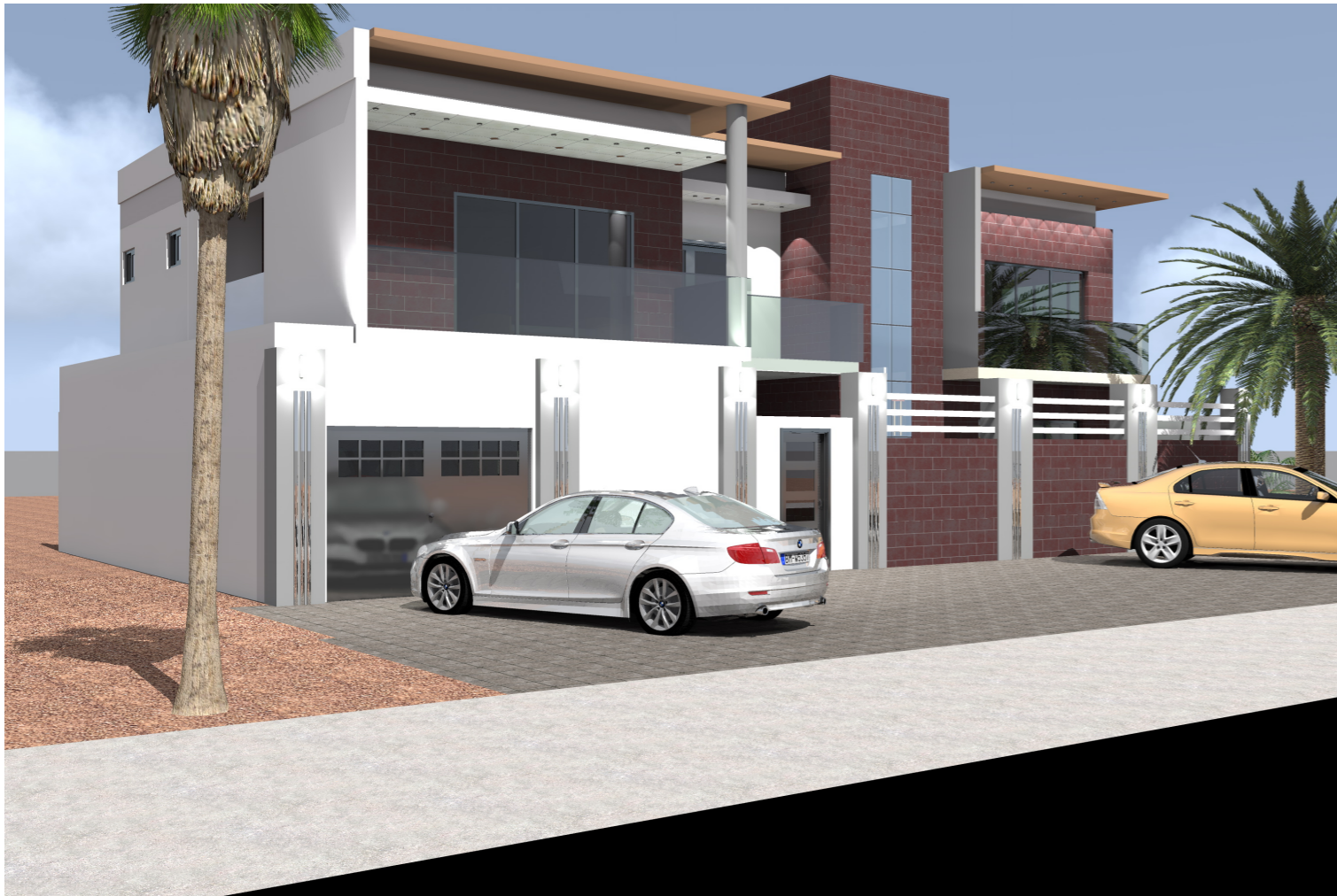
VUE DE PROFIL DROITE