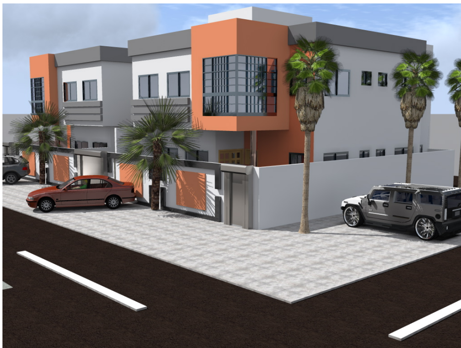
VUE DE PROFIL DROITE