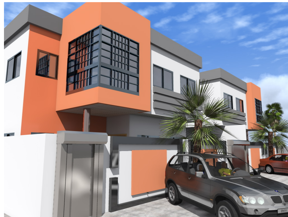
VUE DE PROFIL GAUCHE